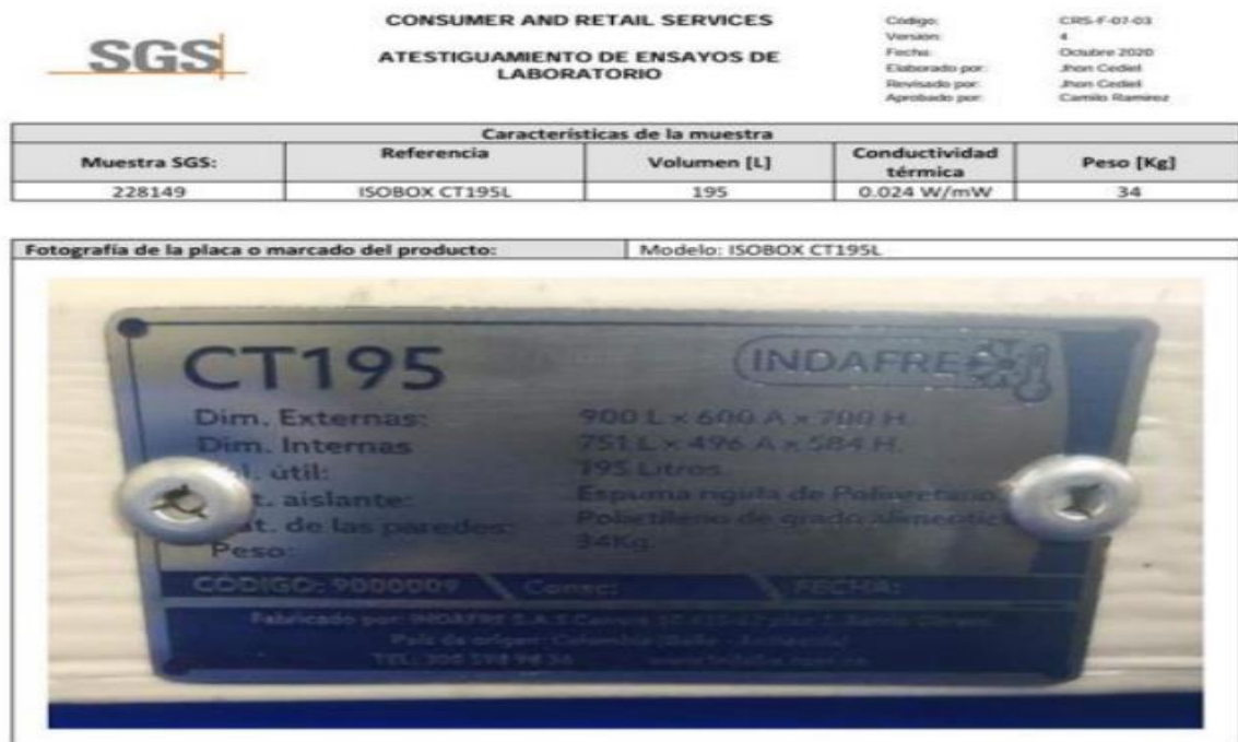
FOTO DE ALIMENTAR

VINCULADOS: Oferentes habilitados en el proceso de contratación PAE departamental 2025